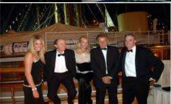
Yachting Club w Sheraton Sopot