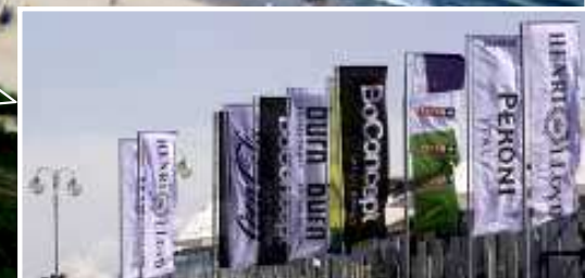
Outdoor wokół mołu oraz ekspozycja samochodów przed Sheraton Sopot